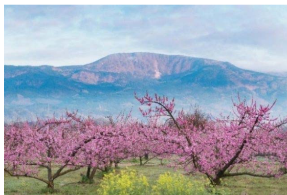
福島県伊達郡桑折町